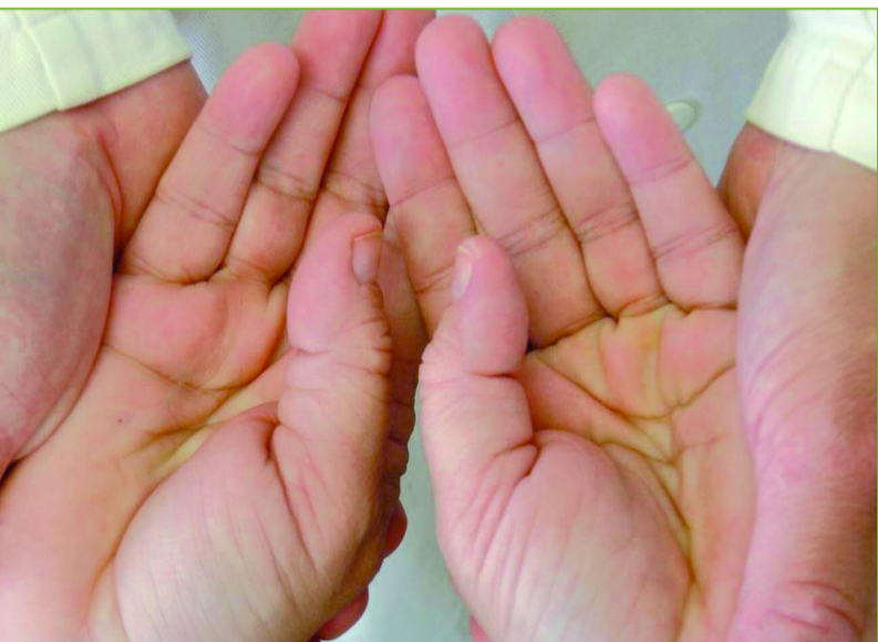
Abb. 1: Die Hände des Patienten in der Hand des Testers beim neutralen Ausgangsbefund

Der Zahnarzt fasst die Hände des Patienten und führt sie unter leichtem Zug gerade nach hinten. Der Test zeigt ein energetisches Ungleichgewicht durch Verkürzung eines Arms, wodurch es