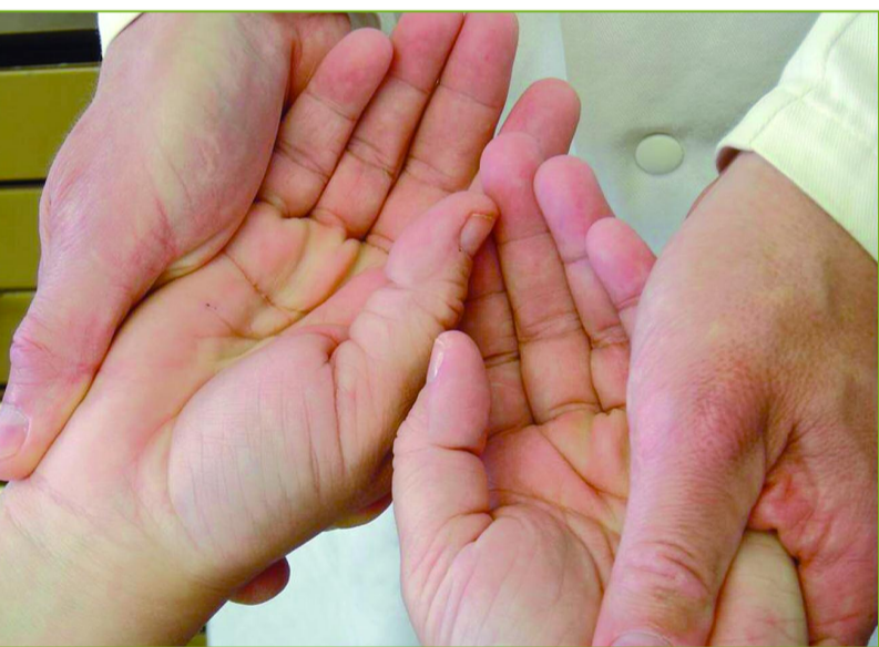
Abb. 2: Die Hände des Patienten in der Hand des Testers beim positiven Armlängenreflex